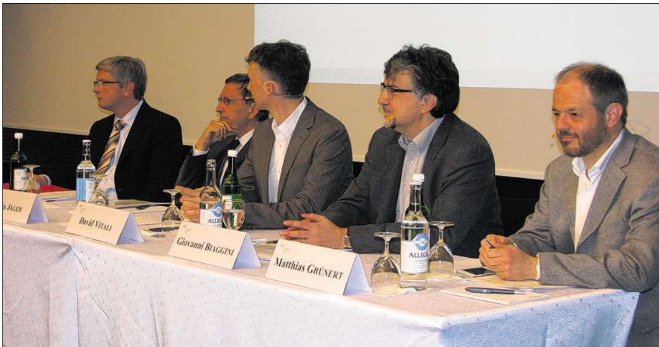
Ils emprims perits sa preparan per tegnair lur referats.