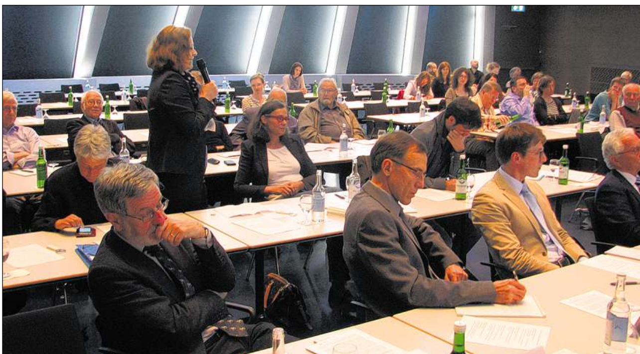
Intgins dals preschents en sala han prendi l'ocasiun per far dumondas.