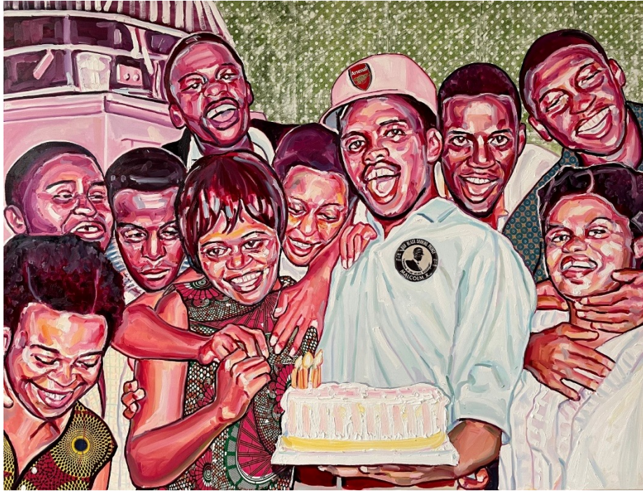
Ausstellung «When We See Us»