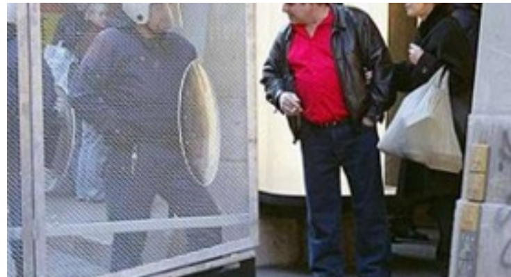
Neugierige Zuschauer – Teilnehmer?