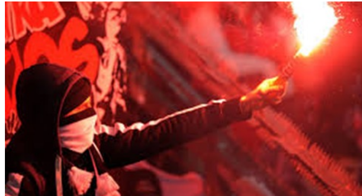
SRF: Ausschreitungen FCZ-Fans