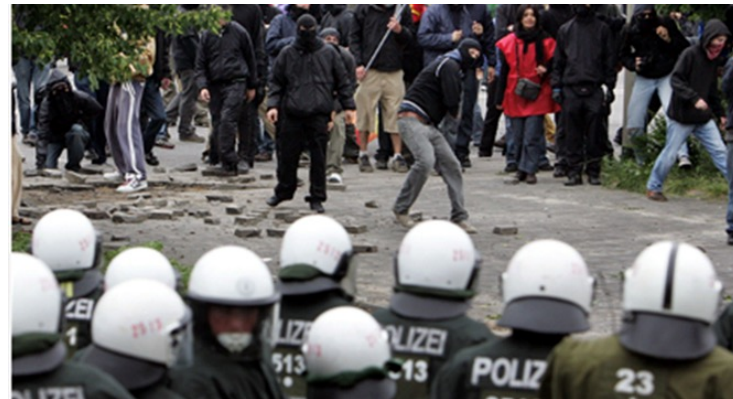
BGE 108 IV 175

«So stellt der tätliche Angriff gegen Polizeiadjunkt X. ebenso eine Gewalttätigkeit... dar wie das Verschmieren von Tramwagen des Kurses 466 mit Sprayfarbe; der Begriff der Gewalttätigkeit setzt zwar eine aktive, aggressive Einwirkung auf Menschen oder Sachen voraus, nicht notwendig aber auch die Aufwendung besonderer physischer Kraft»