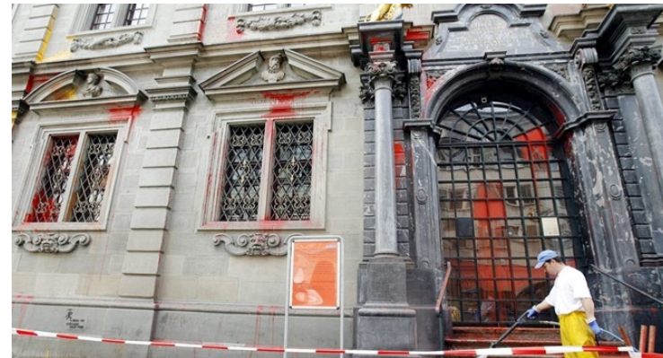
BGE 108 IV 175

«So stellt der tätliche Angriff gegen Polizeiadjunkt X. ebenso eine Gewalttätigkeit... dar wie das Verschmieren von Tramwagen des Kurses 466 mit Sprayfarbe; der Begriff der Gewalttätigkeit setzt zwar eine aktive, aggressive Einwirkung auf Menschen oder Sachen voraus, nicht notwendig aber auch die Aufwendung besonderer physischer Kraft»