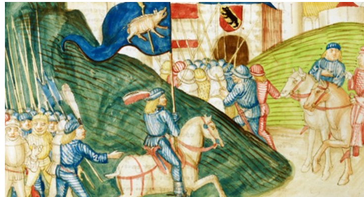
HLS – Saubannerzug - Bild - Einzug Saubannerzug 1477 Bern – Nationalmuseum Pieth, BT 2 , 237 f.