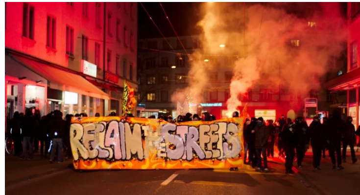
Donatsch/Godenzi/Tag, AT 10 , 113

«Solche sog. objektiven Strafbarkeitsbedingungen... gehören im Gegensatz zu den Tatbestandsmerkmalen nicht zur Umschreibung des verbotenen Verhaltens, sondern beschränken dessen Strafbarkeit auf schwerwiegendere Fälle, in denen ein konkreter Erfolg eingetreten ist... Sie brauchen daher vom Vorsatz nicht umfasst zu sein.»