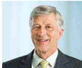
Dr. Rolf Dörig