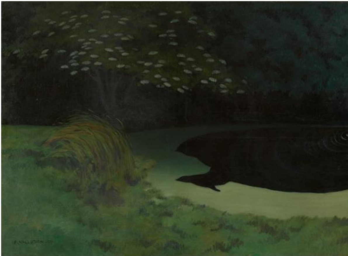
Félix Vallotton La mare