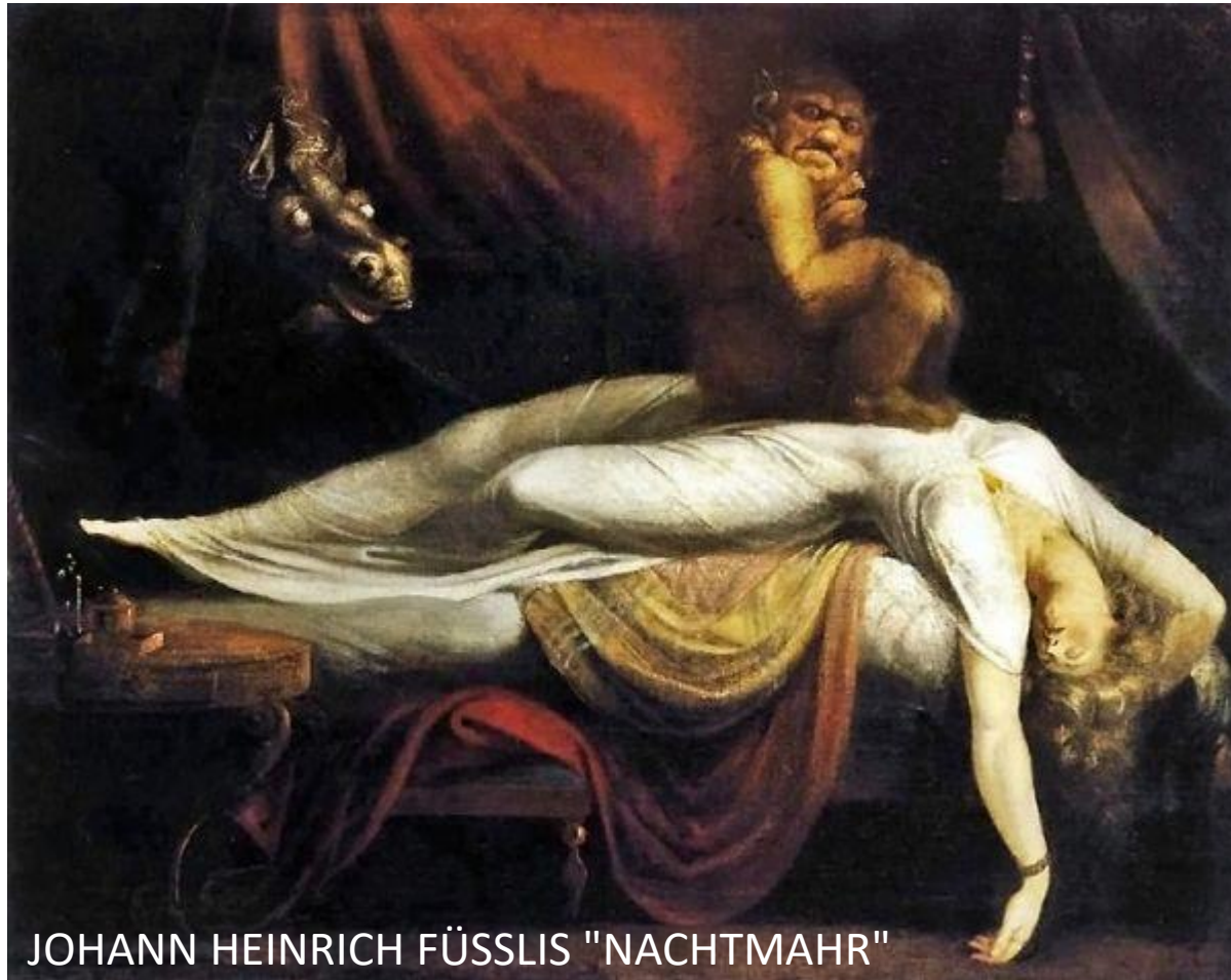
JOHANN HEINRICH FÜSSLIS "NACHTMAHR"

Hat die Verwaltung den politischen Gedanken im Kopf?