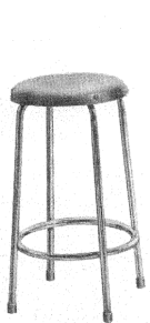
B 114 Thonet