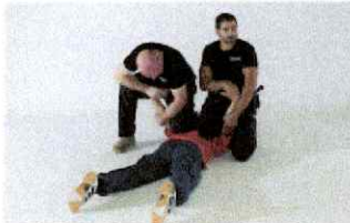
Fixation par levier d'épaule/de poignet en partant de la tête. Genou ou pied posé au sol.