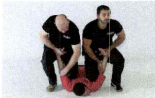
Fixation du bras en haut par levier d'épaule/de poignet depuis les jambes. Genou ou pied posé au sol.