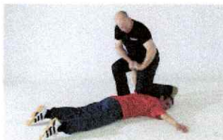
Fixation du bras en haut par levier d'épaule/de poignet depuis la tête.