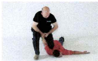
Fixation du bras en haut par levier d'épaule/de poignet depuis les jambes.

Les techniques d'immobilisation citées ci-dessus peuvent être accentuées par une rotation du bras bloqué, respectivement par une clé de poignet.