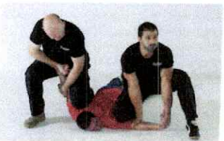
Combinaison possible avec bras fixés en haut et en bas.