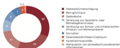
Abbildung 7 Betroffenheit der Top 100-Unternehmen nach Delikttypen* (Angaben in Prozent, Basis: n = 308)