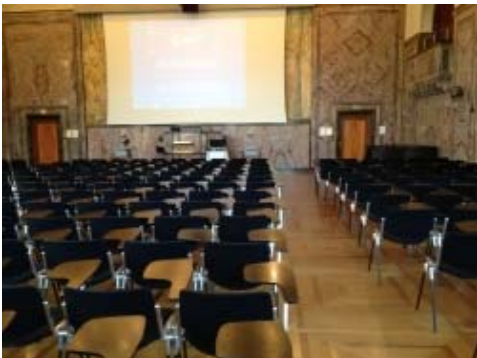
Aula KOL-G-201: Sicht in Richtung Rednerpult.

Zu der Aula gehören zudem noch die zwei Emporen H-301 und H-323 (nur über Stufen erreichbar).