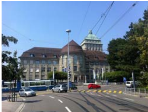
Gebäude KOL : KOL auf der Seite des Haupteingangs Rämistrasse 71.