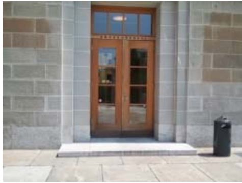
Gebäude KOL : Nebeneingang Kunstlergasse (circa 5 Meter vom Haupteingang Kunstlergasse entfernt).