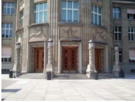
Gebäude KOL : KOL auf der Seite des Haupteingangs Rämistrasse 71.