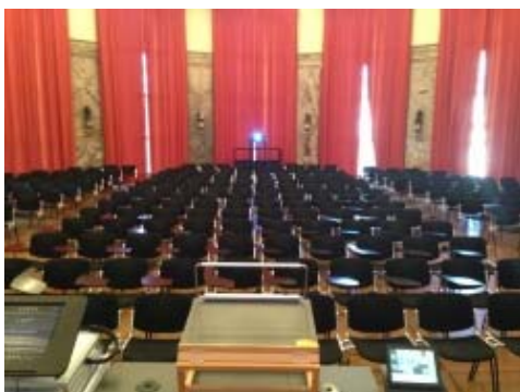
Aula KOL-G-201: Sicht vom Rednerpult aus.