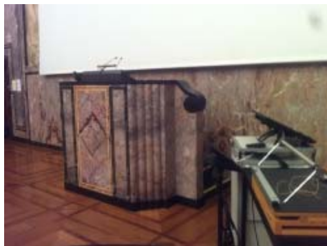
Aula KOL-G-201: Rednerpult (Nahaufnahme).