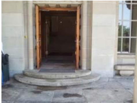
Gebäude KOL : Haupteingang Kunstlergasse.