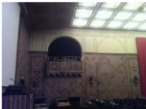
Aula KOL-G-201: Sicht auf eine der Emporen, H-323.