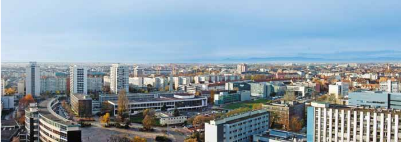
Université de Strasbourg