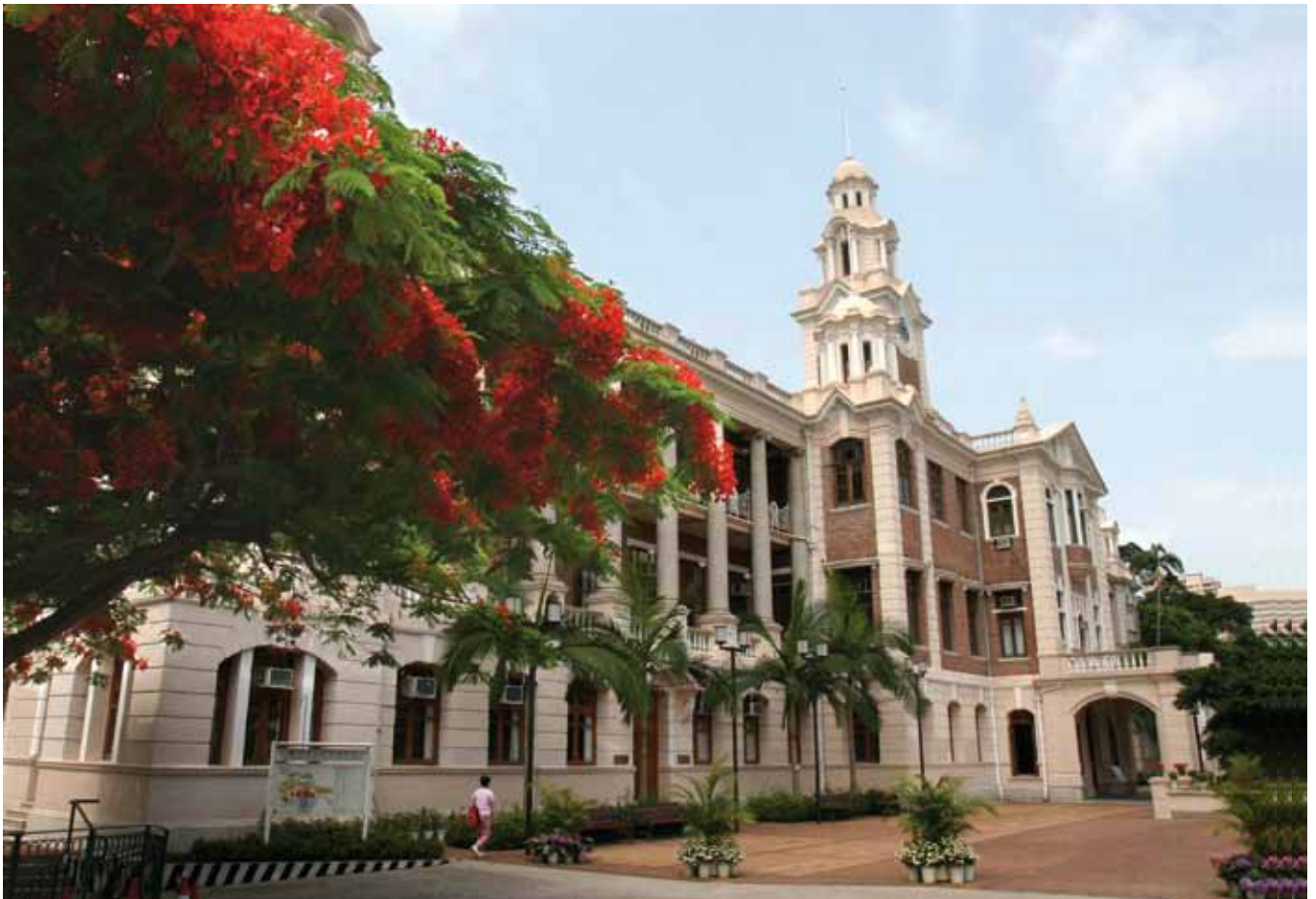
The University of Hong Kong

HK$ 100,000 per year (subject to change)