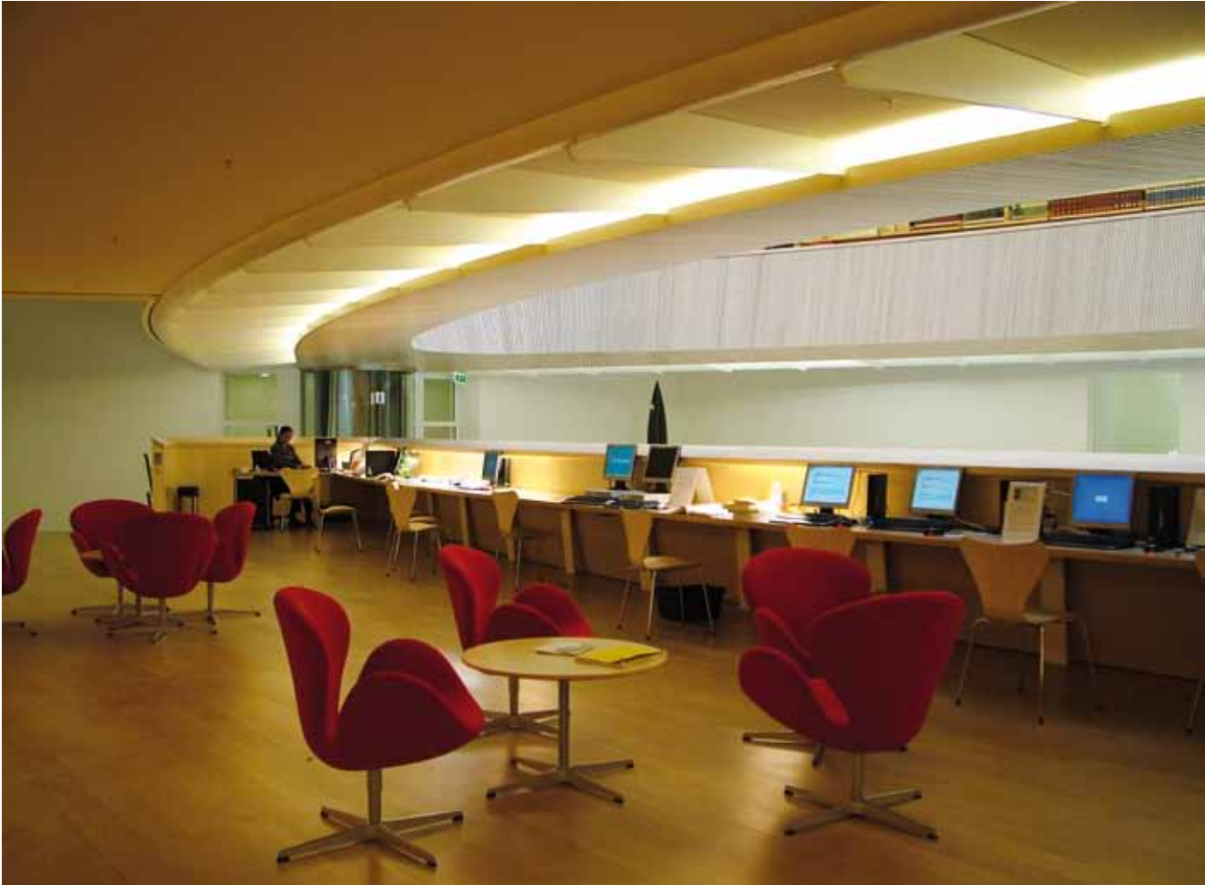
Bibliothek, Rechtswissenschaftliches Institut der Universität Zürich Library, Legal Institute of the University of Zurich