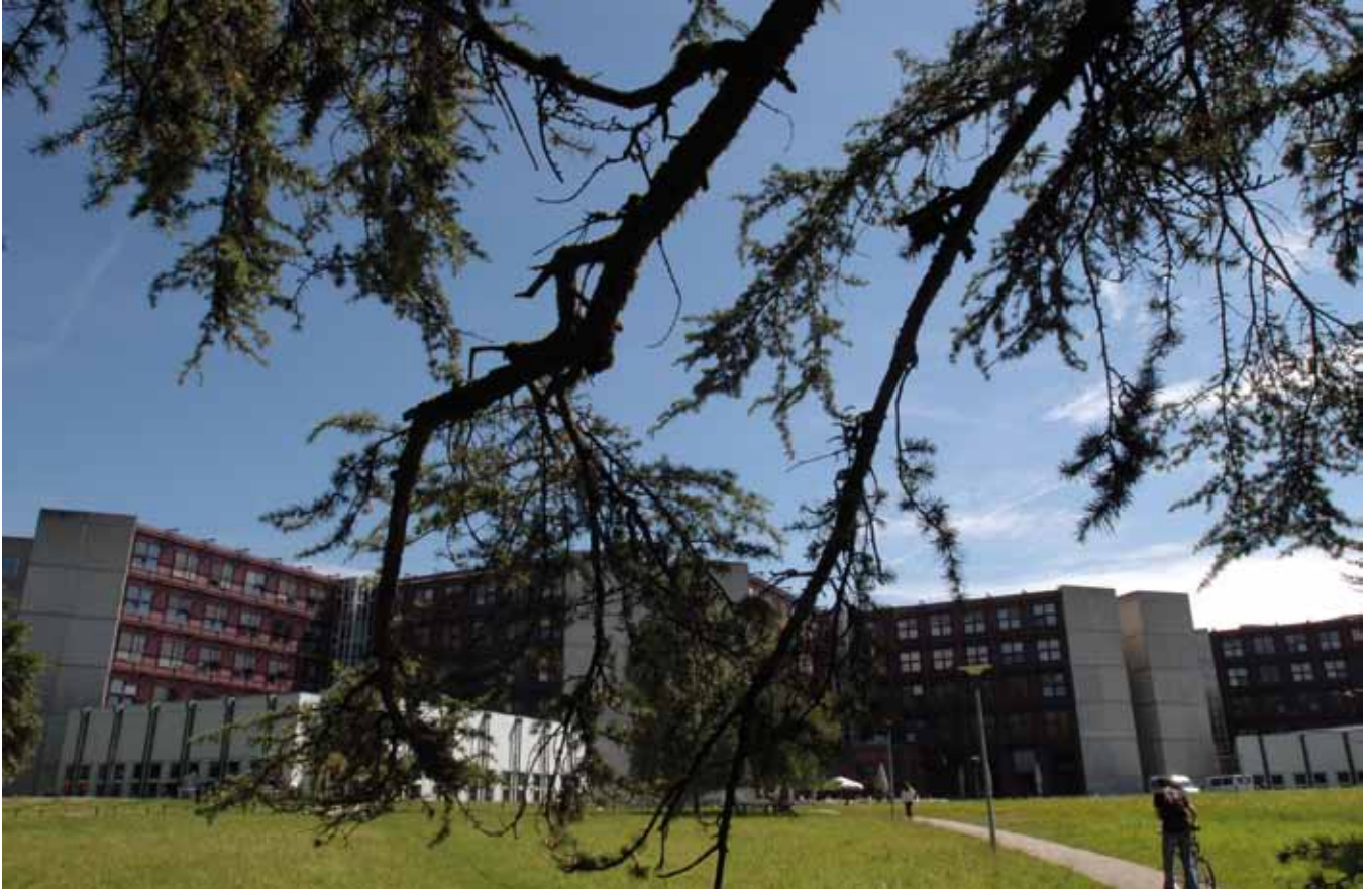
Université de Lausanne