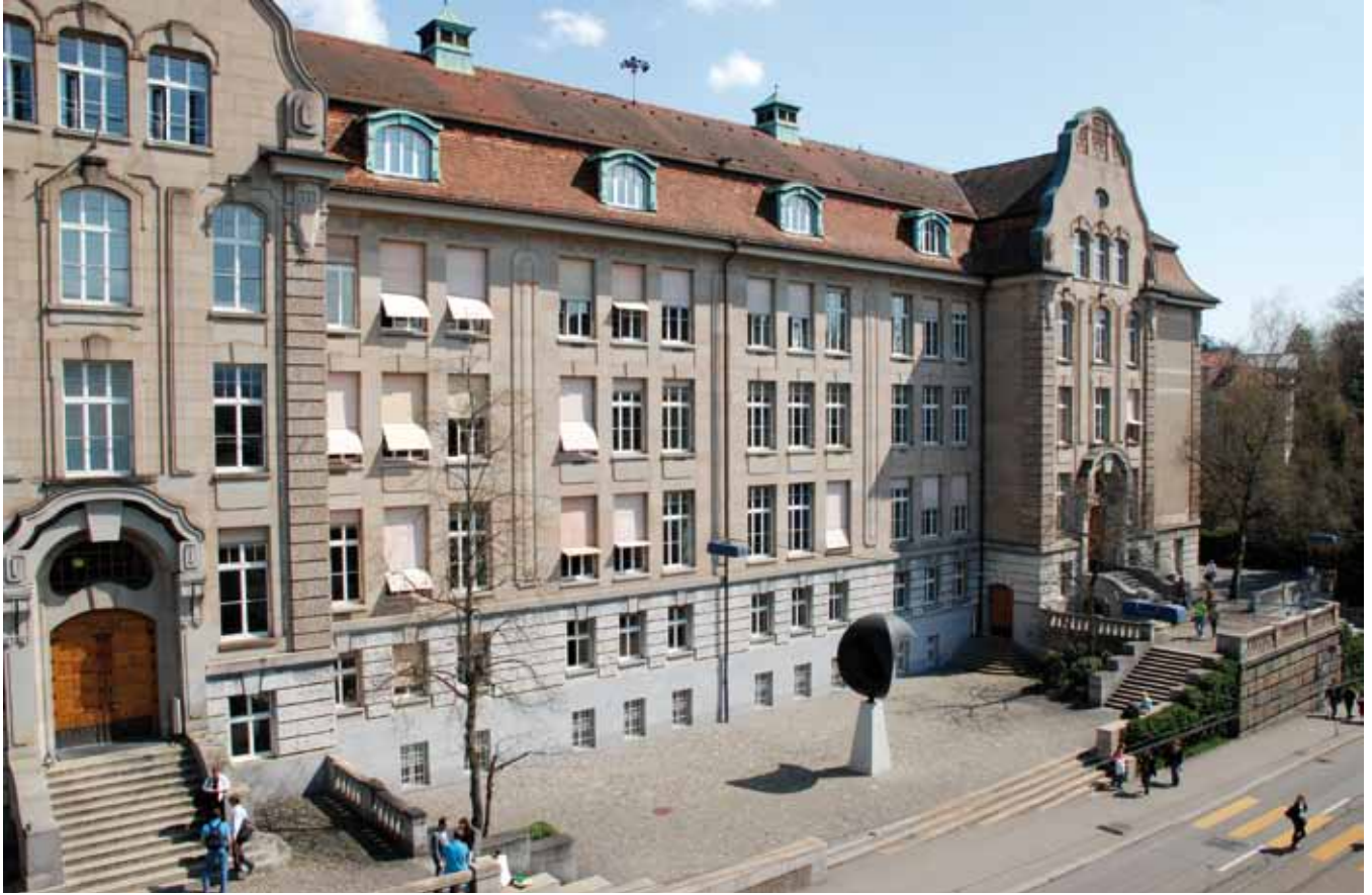
Rechtswissenschaftliche Fakultät der Universität Zürich Faculty of Law at the University of Zurich