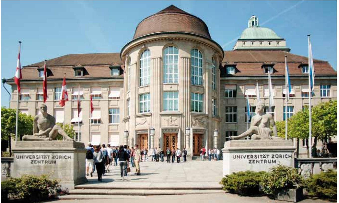
Hauptgebäude der Universität Zürich Main building of the University of Zurich