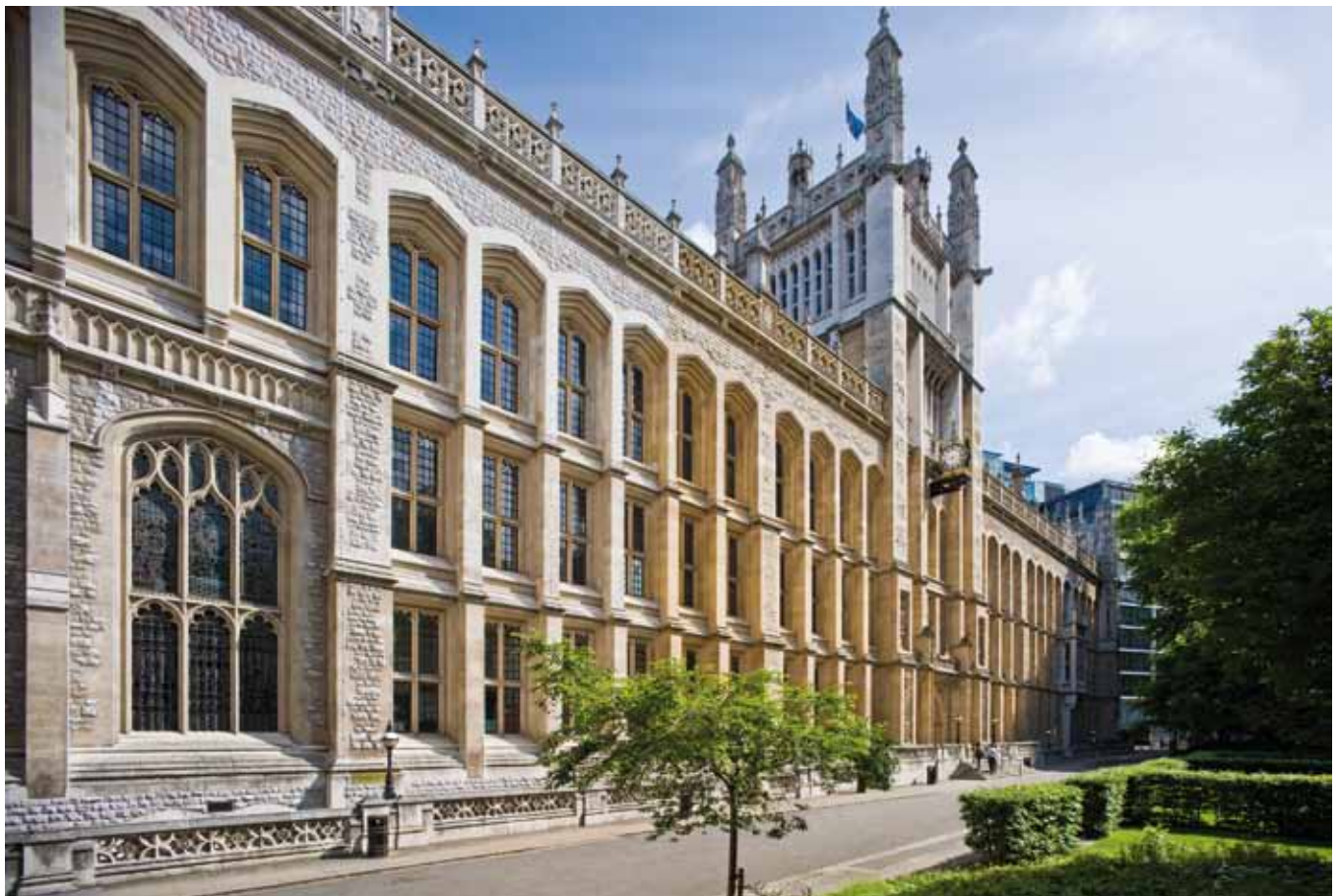
Maughan Library, King's College London