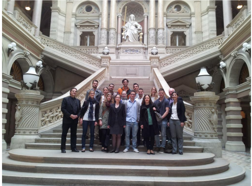
Gruppe im FS 2013 im Obersten Gerichtshof in Wien